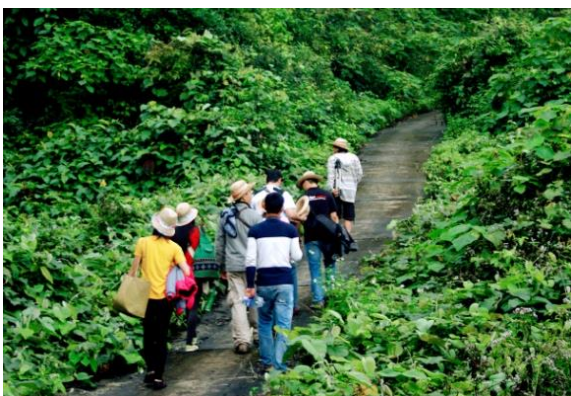
Hình 3. Chương trình “ I Love Sơn Trà ”