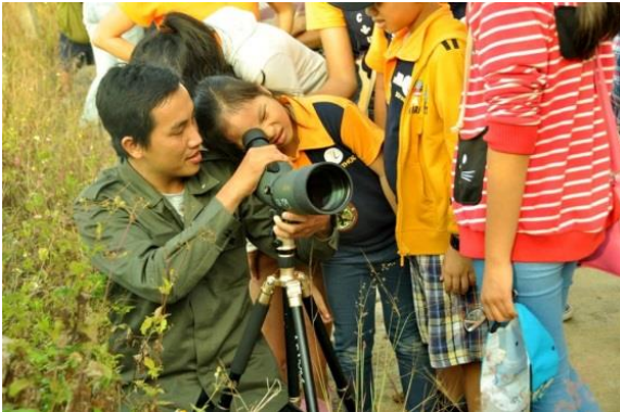
Hình 2. Chương trình Hiệp sĩ nhí rừng Sơn Trà

Tiêu biểu có thể kể đến các chương trình “ Hiệp sĩ nhí rừng Sơn Trà ”, “ Khám phá thế giới hoang dã mùa hè ”, “ Giáng sinh cùng Vọc chà vá chân nâu ” của Trung tâm Đa dạng sinh học Nước Việt Xanh (GreenViet) tổ chức cho trường Tiểu học và Trung học cơ sở trên địa bàn thành phố trong những năm qua. Các hoạt động này đã tăng cường kiến thức, hiểu biết và nâng cao nhận thức cho các em về cuộc sống động vật hoang dã, đồng thời hiểu được công việc của những người làm công tác bảo tồn ở Trung tâm.