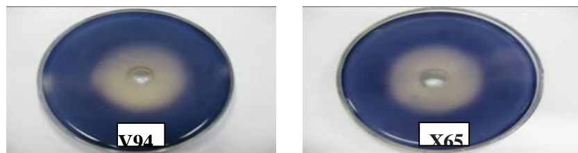
Hình 1. Vòng phân giải tinh bột của dịch enzyme amylase tách từ chủng V94 và X65 nuôi cấy trong điều kiện tối ưu

("D -d": đường kính vòng phân giải, "SKK": sinh khối khô)