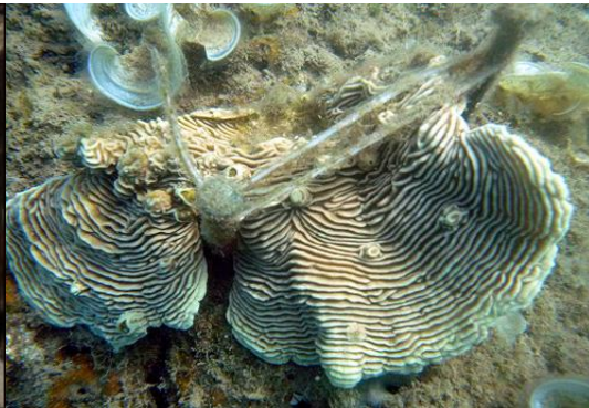
Hình 4. San hô cứng ở Cù Lao Chàm

Năm 2014, xã đảo Tân Hiệp phấn đấu tổng sản lượng khai thác hải sản đạt 1.000 tấn.