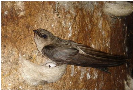
Hình 3. Yến sào Cù lao Chàm

Diện tích mặt nước có khả năng phát triển nuôi trồng thủy sản khoảng 6700 ha. Đây là vùng