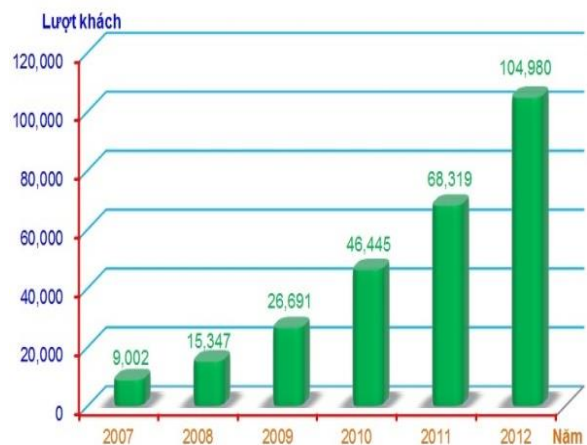
Hình 2. Lượt khách đến tham quan Cù Lao Chàm giai đoạn 2007-2012

Năm 2012 Cù Lao Chàm đã đón đến gần 105 nghìn lượt khách, doanh thu từ hoạt động du lịch là 30,6 tỷ đồng. Cơ cấu doanh thu dịch vụ vận chuyển chiếm 63%, các dịch vụ ăn uống gần 25%, lặn biển 5%, tham quan gần 3,4%, và nghỉ trọ 2%. Năm 2013, tổng lượt khách du lịch đến Cù Lao Chàm đạt gần 170.000 lượt người, trong đó khách quốc tế chiếm hơn 1/3. Theo ghi nhận, vào 2 ngày thứ Bảy và Chủ nhật trung tuần tháng Bảy năm 2013 đã có trên 4 nghìn lượt khách đến đây. Bình quân mỗi ngày một khách đến tham quan Cù Lao Chàm chi tiêu khoảng 300 nghìn đồng thì doanh thu du lịch dự kiến đến năm 2015 đạt khoảng 60 - 62 tỷ đồng, đến năm 2020 đạt 120 tỷ đồng và mục tiêu đặt ra mỗi năm sau 2015 sẽ đón khoảng 200 nghìn lượt khách đến tham quan.